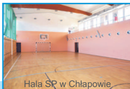
Hala SR w Chłapowie

Ośrodek Wczasowy „Hutnik” ul. Kuracyjna 6, 84-104 Jastrzębia Góra tel. 58 73 956 60, kom. 572 671 293, e-mail: biuro@hutnik.net