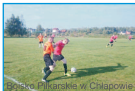
Boisko Piłkarskie w Chłapowie

Cena zawiera: noclegi, wyżywienie, program animacyjny prowadzony przez instruktora k-o, opiekę pielęgniarki (średki opatrunkowe, bez lekarstw), opiekę ratownika WOPR, możliwość korzystania z infrastruktury ośrodka (wstęp na basen dla grup co drugi dzień, dodatkowy wstęp - 15 zł/os.), 1 ognisko z pieczeniem kiełbasek w turnusie, 2 dyskoteki, wyposażenie w sprzęt świetlicowy, pobyt kadry pedagogicznej - 1 osoba na pełnych 15 uczestników oraz kierownik grupy (powyżej 45 os.) - gratis.